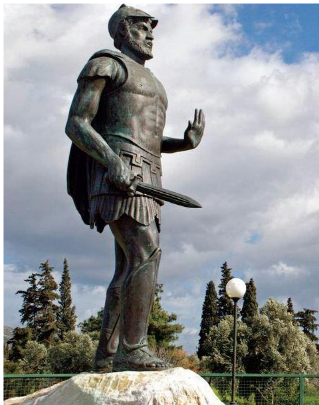
Ἀνδριάντας τοῦ Στρατηγοῦ Μιλτιάδη, πού βρίσκεται ἔξω ἀπὸ τὸν ἀρχαιολογικό χῶρο τοῦ Τύμβου τῶν Ἀθηναίων, στὸν Μαραθῶνα.

Μόλις οἱ Πέρσες ἄρχισαν νὰ ἀποβιβάζωνται στὸν Μαραθῶνα, συνῆλθε στὴν Ἀθήνα τὸ πολεμικὸ Συμβούλιο τῶν 10 Στρατηγῶν γιὰ τὴν ἀντιμετώπιση τῆς καταστάσεως. Προβλήθηκαν 3 τρόποι ἐνεργείας: ἄμυνα στὴν Ἀθήνα, ἄμυνα στὴν προχωρημένη θέση τῆς Παλλήνης καὶ τέλος ταχεῖα κίνηση πρὸς τὸν Μαραθῶνα – ἐπίθεση κατὰ τοῦ ἐχθροῦ.