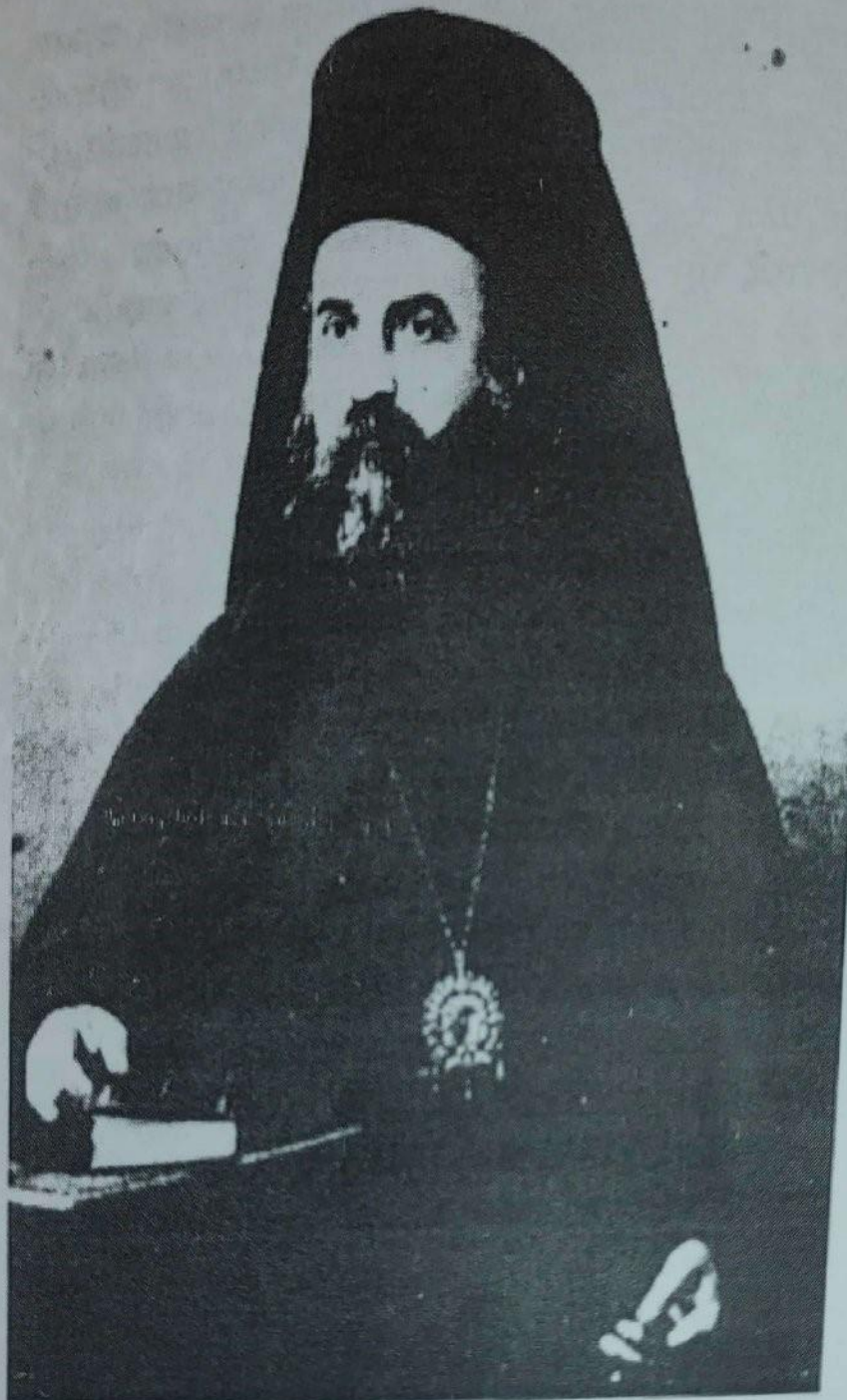
Ὁ Ἅγιος Νεκτᾶριος Πενταπόλεως