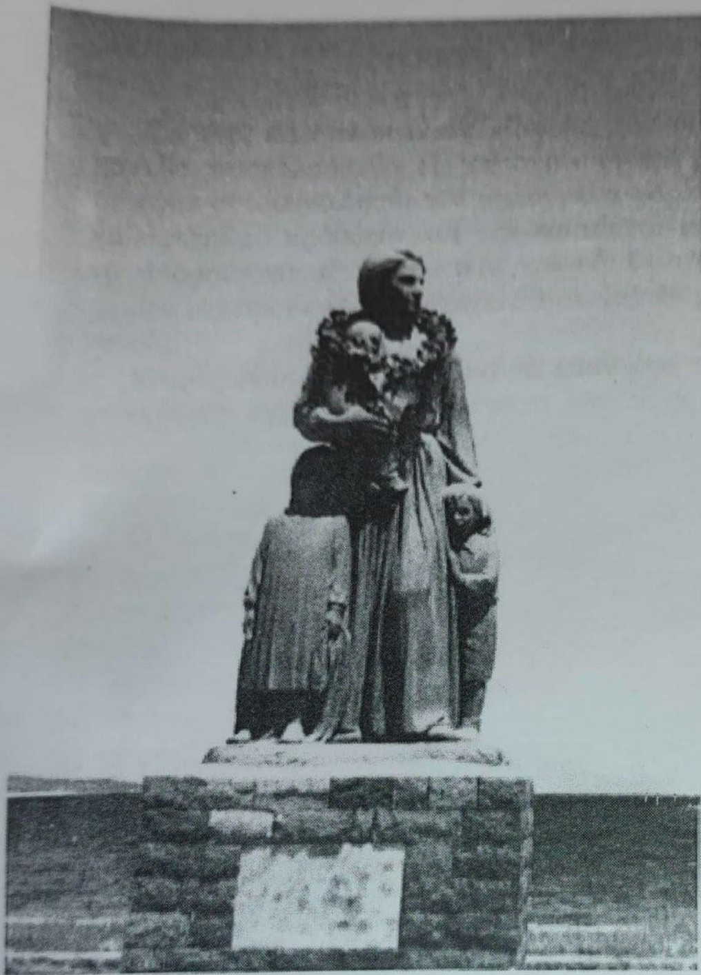
«Στην Μικρασιάτισσα Μάνα ή Λέσβος τιμώντας. Ό- κτώβρης 1984». Έπάνω Σκάλα Μυτιλήνης. Έργο γλυπτριάς Κατερίνας Χαλεπά - Κατσάτου.