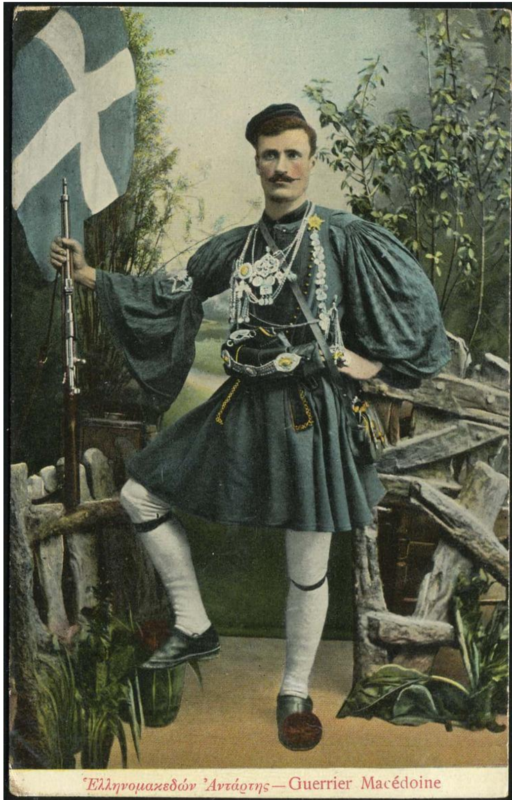
Ἑλληνομακεδὼν Ἀντάρτης—Guerrier Macédoine