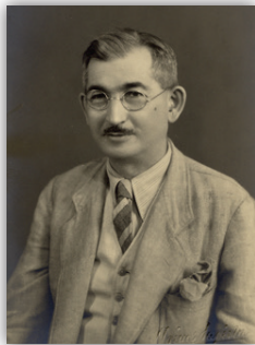
Ὁ Κωνσταντῖνος Καραβίδας.

Σέ αὐτό τό σκηρικό, περιθωριακή μόνον θέση μποροῦσαν νά ἔχουν αὐθεντικοί διανοοῦμενοι, πού συνήγαγαν τά συμπεράσματά τους ἀπό μακρά καί ἐπίπονη ἔρευνα ἐπὶ τοῦ πεδίου. Κορυφαία παραδείγματα ὁ Δημοσθένης Δανηλίδης, πού δημοσίευσε τό 1934 τήν Νεοελληνική Κοινωνία καί Οἰκονομία , ἕνα πραγματικό κάτοπτρο ἐθνικῆς αὐτογνωσίας, καί ὁ Κωνσταντῖνος Καραβίδας, πού τό 1935 ἐξέδωσε τήν Κοινοτική Πολιτεία , ὅπου πρότεινε ἕναν βιώσιμο τρόπο αὐτόνομης οἰκονομικῆς ἀνάπτυξης τῆς χώρας. Ἀλλά τέτοιου εἴδους αὐτόνομα πνεύματα ἦσαν μοναχικές ἐξαιρέσεις, πού ὄχι μόνον παρέμειναν στό περιθώριο ἀλλά ἀντιμετώπισαν καί προβλήματα βιοπορισμοῦ. Αὐτοί οἱ προβληματισμοί, πού ἀναπτύχθηκαν πέραν τοῦ κυρίαρχου δίπολου μαρξισμός - ἀντιμαρξισμός, τότε μέν ἔμοιαζαν ἰδιόρρυθμοι, σήμερα ὅμως φαίνονται πιό ἐνδιαφέροντες, οὐσιώδεις καί πρωτότυποι ἀπό τήν τελικῶς ἄγονη κυρίαρχη τότε ἀντιπαράθεση.