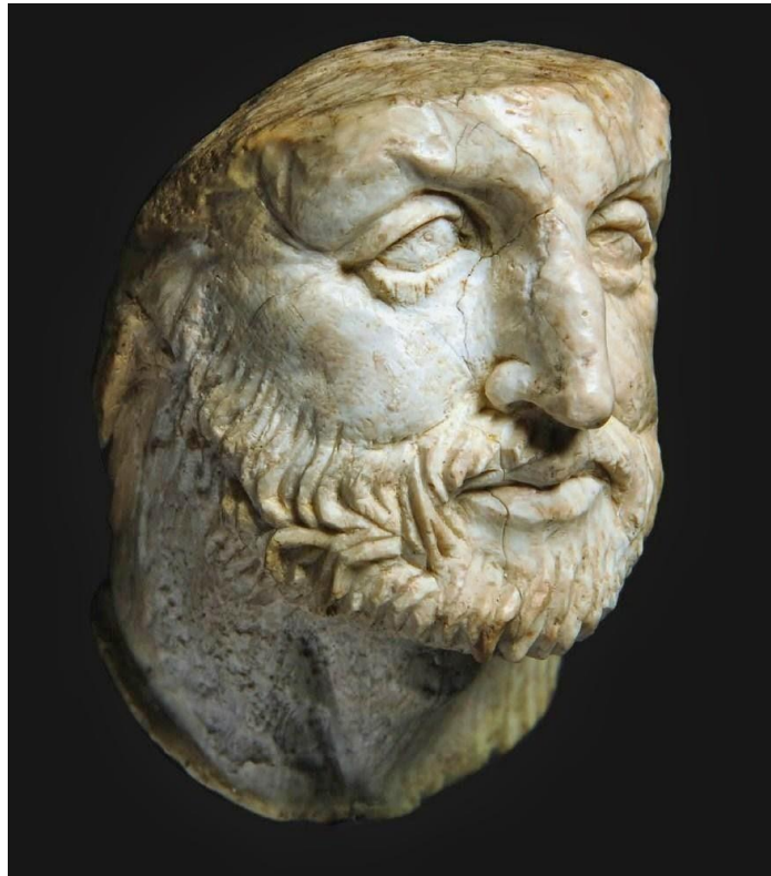
Φίλιππος Β΄, Βασιλιάς της Μακεδονίας (382-336 π.Χ.)

Το 347 π. Χ., ο βασιλιάς της Μακεδονίας Φίλιππος ο Β΄ ήλθε σε επαφή με τον Ερμεία, με τον οποίο σύνηψε συμμαχία. Ο Δημοσθένης ανέφερε στον Δ΄ Φιλιππικό λόγο του ότι ο Ερμείας γνώριζε και συνέπραττε με τα σχέδια του βασιλιά της Μακεδονίας, εναντίον των Περσών, για την απελευθέρωση των Ελληνικών πόλεων της Μικράς Ασίας [10] .