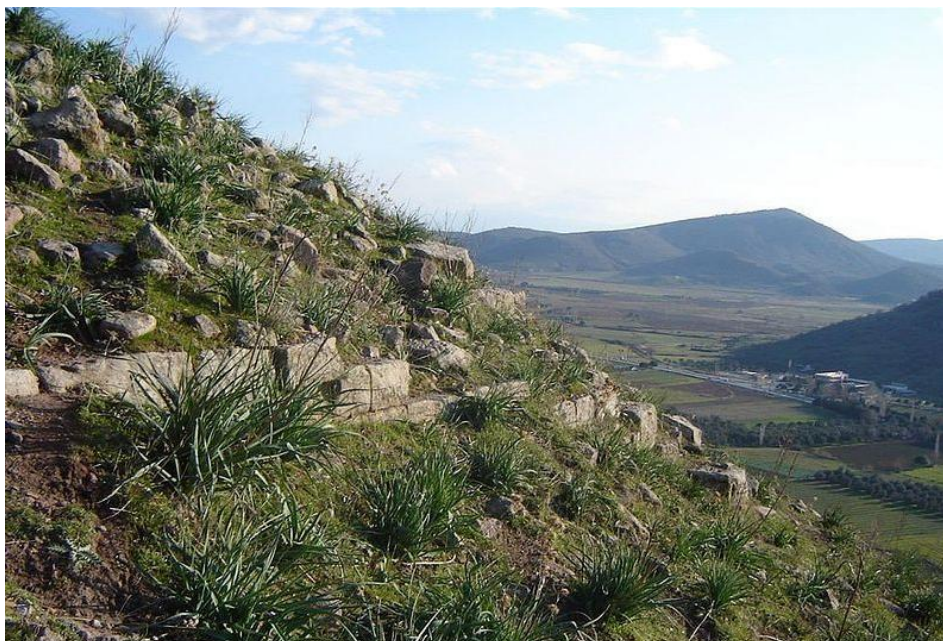
Ερείπια του Αταρνέως

Οι αρχαίοι ιστορικοί Θεόπομπος και ο Θεόκριτος υποστηρίζουν ότι ο Ερμείας ήταν βάρβαρος, καθώς επίσης και ότι ήταν ευνούχος. Η αρνητική αυτή κριτική, ίσως να οφειλόταν στο γεγονός της ανάληψης της εξουσίας του Αταρνέως, υπό τη μορφή τυραννίδας, από τον Εύβουλο και την απόσπασή του από τον έλεγχο της Χίου. Όταν ο Θεόπομπος και ο Θεόκριτος δύο ιστορικοί από τη Χίο, είναι εμφανές ότι ήταν δυσαρεστημένοι από το παραπάνω γεγονός και τους υπαίτιους του. Ωστόσο οι ισχυρισμοί τους αυτοί δεν είναι αληθείς. Κατ' αρχάς ο ίδιος ο Θεόπομπος παραδέχεται ότι ο Ερμείας ήταν «χαρίεις και φιλόκαλος» [4] , δηλαδή εκλεπτυσμένος και λάτρης του πολιτισμού, κάτι που δεν συνηθιζόταν να αποδίδεται στους βαρβάρους. Επίσης, αναφέροντας ότι η πόλη των Ηλείων διεκήρυξε ολυμπιακή εκχειρία, προς τιμήν του Ερμεία, ο Θεόπομπος μας επιβεβαιώνει την Ελληνική καταγωγή του [5] . Όσο για την κατηγορία περί ευνούχου, την αναιρεί το γεγονός ότι ο Ερμείας έλαβε ηγετικό αξίωμα, το οποίο δεν ελάμβαναν οι ευνούχοι στην αρχαιότητα.