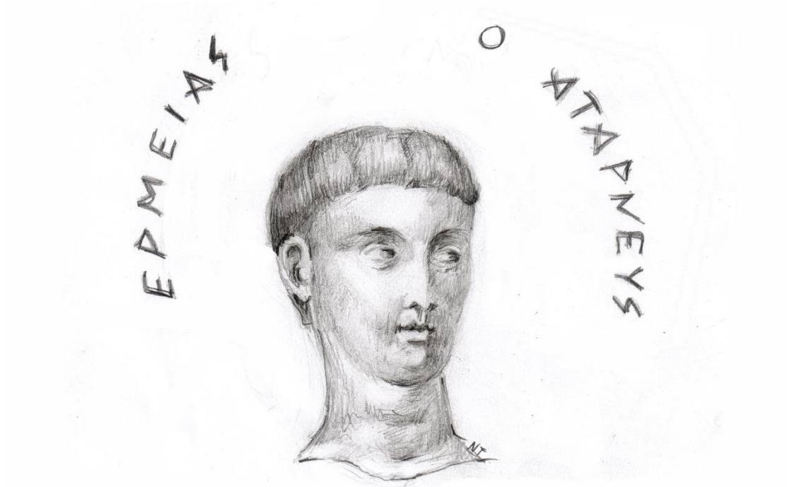
Ερμείας ο Αταρνεύς – Προσωπογραφία της Νίκης Απ. Τσάφου- Λάππα, ζωγράφου