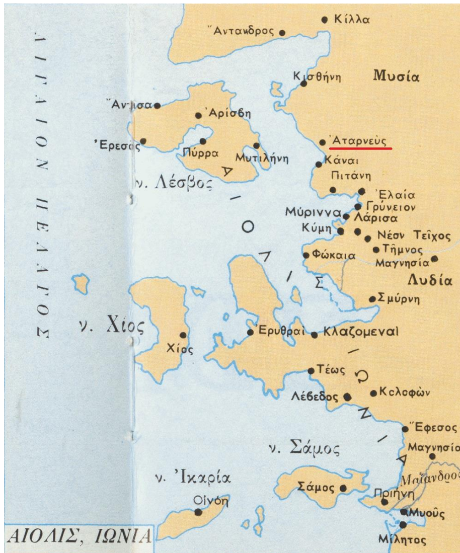
Αιολίς - Ιωνία

Διαδεχόμενος τον Εύβουλο, ο Ερμείας προσκάλεσε τους παλιούς συμμαθητές του Έραστο και Κορίσκο, στους οποίους ανέθεσε και τη διοίκηση της Άσσου και τροποποίησε τους όρους του πολιτεύματος [9] . Χάρη σ' αυτή του την ενέργεια, πολλές Ελληνικές πόλεις της Μικράς Ασίας ενσωματώθηκαν εθελούσια στο κράτος του.