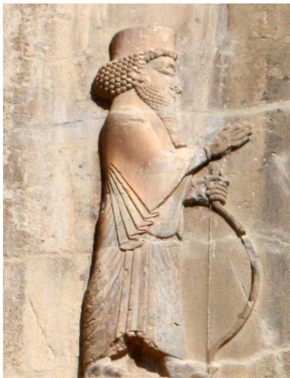
Αρταξέρξης Γ΄ της Περσίας

Το 341 π. Χ., ο βασιλιάς των Περσών Αρταξέρξης Γ', με σκοπό να ανακτήσει τα χαμένα του εδάφη στην Μικρά Ασία, έστειλε τον Έλληνα μισθοφόρο στρατηγό του, τον Μέντορα τον Ρόδιο, να πολεμήσει τον Ερμεία [13] . Ο Αριστοτέλης, ευρισκόμενος στη Μακεδονία, έστελλε στον Μέντορα επιστολές, στις οποίες τον συμβούλευε να εγκαταλείψει τον Αρταξέρξη και να συμμαχήσει με τον Ερμεία [14] , χωρίς όμως αποτέλεσμα. Ο Μέντωρ κατάφερε να παρασύρει τον Ερμεία σε συνάντηση και, με αυτό το τέχνασμα, τον συνέλαβε, του πήρε το δαχτυλίδι και έγραψε επιστολές στις οχυρωμένες πόλεις του Αταρνέως, λέγοντας ότι δήθεν ο Ερμείας είχε συνάψει ειρήνη με τους Πέρσες [15] . Οι κάτοικοι αυτών των πόλεων, πιστεύοντας τις επιστολές, παρέδωσαν τις πόλεις και τα φρούρια στους Πέρσες [16] .