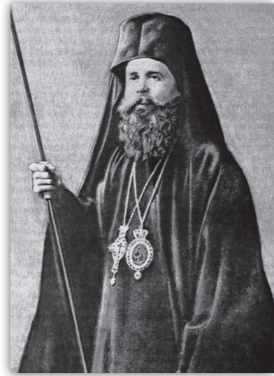
Ἀρχιεπίσκοπος Ἀθηνῶν Χρυσάνθος.

Τό 1939, ἀκριβῶς πρὶν ἀπό 83 χρόνια, ἐνώπιον τῆς Ἀκαδημίας Ἀθηνῶν, πού τόν ἐξέλεξε μέλος της, ὁ Ἀρχιεπίσκοπος Ἀθηνῶν Χρυσάνθος, ἐπεσήμανε τόν κίνδυνο τῆς Ἑλλάδος καὶ προφητικά, μεταξύ ἄλλων, εἶπε: «Δι' ἡμᾶς τοὺς λαοὺς τῆς καθ' ἡμᾶς Ἀνατολῆς, ὁ ἐξευρωπαϊσμός ὑπό οἰανδήποτε μορφὴν δέν εἶναι πρόοδος, εἶναι ὀπισθοχώρησις καὶ εἶναι ἀσθένεια. Εἶναι ἡ εὐφορία τοῦ φθι-