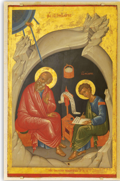
Ὁ ἅγιος Ἰωάννης ὁ θεολόγος καί Εὐαγγελιστής.

Ὡς άντίδοτα στήν σημερινή κρίση μπορούμε νά ποῦμε ὅτι εἶναι ἡ Ἁγία Γραφή, οἱ Θεοφόροι Πατέρες, οἱ βίοι τῶν