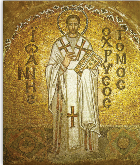
Άπεικόνιση του άγίου Ίωάννου του Χρυσοστόμου σέ ψηφιδωτό της Άγίας Σοφίας Κωνσταντινούπολης.

«Τήν Έλλάδα δέν μπορείς να τήν κατακτήσης μέ τά όπλα, παρά μόνο μέ τήν γλώσσα, τήν θρησκεία και τήν ιστορία. Ό έλληνικός λαός, είπε, είναι άτίθασος, γι' αυτό πρέπει να πλήξουμε βαθιά τίς πολιτιστικές του ρίζες, άλλοιώνοντας και εξαφανίζοντας τόν έλληνικό πολιτισμό, τίς παραδόσεις και όλα τά πνευματικά και ιστορικά άποθέματά του, ώστε να έξουδετερώσουμε κάθε δυνατότητά του, να άναπτυχθῆ, να διακριθῆ, να επικρατήση, για να μής μάς παρενοχλή». Προηγούμενως, τό 1979, ό ίδιος είχε άποκαλύψει σ' έναν Έλληνα φοιτητή του, στό πανεπιστήμιο του Χάρβαντ, ότι μέχρι τό 2018 δέν θά ύπάρχη Έλλάδα, προφανώς, όχι γεωγραφικά, αλλά δέν θά ύπάρχη τίποτε δικό της. Μέ ποιό τρόπο; Ροκανίζοντας τά βασικά κύτταρα της φυλής μας, τήν γλώσσα, τήν θρησκεία, τόν πολιτισμό και τήν ιστορία μας, μέ τήν ψήφιση και καθιέρωση νομοθετημάτων πού άλλοιώνουν τήν συνείδηση, τίς παραδόσεις και τήν θρησκευτικότητα μας, ως όρθόδοξου χριστιανικού λαού.