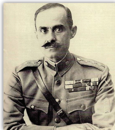
Ό Νικόλαος Πλαστήρας, όταν ήταν Συνταγματάρχης (περίπου 1919-1922).

ξης: «Είναι όλοφάνερο, ότι τώρα χωρίζονται οί πλευρές. Έτσι, άν είσαι στην άλλη πλευρά του φράκτη, είσαι ξαφνικά άντι-άμερικανός. Και αυτό γεννάει τόν φόβο του νά είσαι στην λάθος πλευρά. Η Δημοκρατία είναι πολύ εύθραστο πράγμα. Τήν ώρα πού θά σταματήσης νά τής φέρεσαι υπεύθυνα και τής έπιτρέπης νά μετατραπή σε τακτική έκφοβισμού, δέν είναι πλέον δημοκρατία. Είναι κάτι άλλο. Κάτι πού μπορεί νά απέχη μερικά έκατοστά άπό τόν όλοκληρωτισμό». Έξ ανάγκης, θά περιοριστώ μόνο σε δυό ιστορικά πρόσωπα, πρότυπα για τήν ανθρωπότητα, και προεχόντως, για τήν χώρα μας. Πρώτον, τόν Ίωάννη Καπποδίστρια πού αγάπησε, όπως έλάχιστοι τήν Ελλάδα και για τήν όποία θυσιάστηκε, άφου έκτός άλλων, άπό τήν προσωπική του περιουσία, παρείχε ύποτροφίες κάθε έτος σε 500 άτομα, μεταξύ των όποίων και στό μετέπειτα δολοφόνο του, τόν Γεώργιο Μαυρομιχάλη. Και δεύτερο στόν ΜΑΥΡΟ ΚΑΒΑΛΛΑΡΗ , τόν Συνταγματάρχη Νικόλαο Πλαστήρα, άπό τόν όποιο οί σημερινοί πολι-