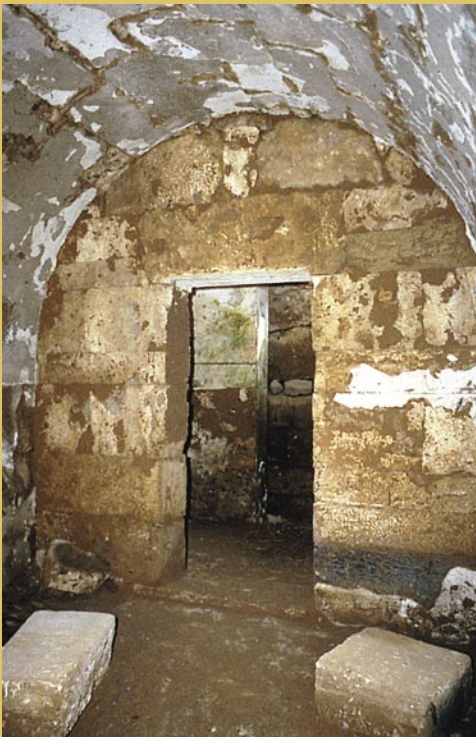
Σπηλιά. Εσωτερικό του τάφου.