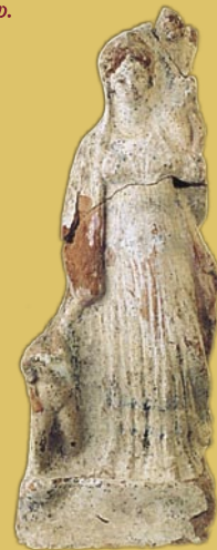
Σπηλιά. Ειδώλιο Αφροδίτης.