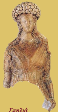
Σπηλιά. Ειδώλιο γυναικείας μορφής.

Τα κτερίσματα του τάφου χρονολογούνται από το β' τέταρτο του 2 ου αι. π.Χ. ως το τελευταίο τέταρτο του 1 ου αι. π.Χ. Η σύγκριση, ωστόσο, με άλλα μνημεία του είδους, μας οδηγεί σε πολύ προαϊμότερη ένταξη, στον 4 ο αι. π.Χ. Αν τούτο ισχύει, συμπεραίνουμε ότι ο τάφος καθαρίστηκε από τις πρώιμες ταφές και παρέμειναν σ' αυτόν οι οψιμότερες.