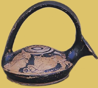
Πύργοι. Ερυθρόμορφος ασκός των μέσων του 4 ου αι. π.Χ.