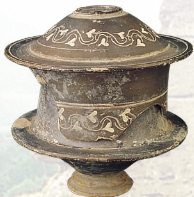
Σπηλιά. Πήλινη ποξίδα, α' μισό 2 ο αι. π.Χ.