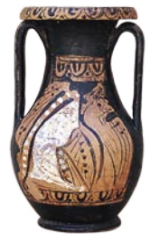
Πύργοι. Ερυθρόμορφη πελίκη, τέλη 4 ου αι. π.Χ.

Τα ευρήματα του τάφου τον χρονολογούν σε μια πρόιμη σχετικά εποχή, δηλαδή στο τελευταίο τέταρτο του 4 ου αι. π.Χ., κατατάσσοντάς τον στα αρχαιότερα δείγματα του είδους.