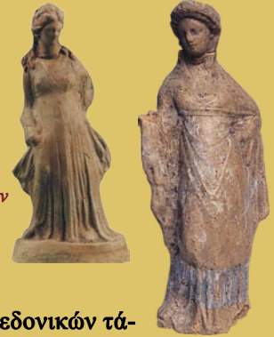
Σπηλιά. Ειδώλια γυναικείων μορφών.

Η αποκάλυψη και συστηματική έρευνα των μακεδονικών τάφων στη Σπηλιά και τους Πύργους, και παλαιότερα ο εντοπισμός παρόμοιου στις Λικνάδες Βοΐου, επιβεβαιώνει την κοινή ταυτότητα ταφικών εθίμων και πρακτικών μεταξύ Κάτω και Άνω Μακεδονίας, ανατρέποντας μ' αυτό τον τρόπο την πεποίθηση περί πολιτιστικής και κοινωνικής απομόνωσης της δευτέρης. Επιπλέον, προσθέτει δύο ακόμα δείγματα στην ποικιλία της αρχιτεκτονικής μορφής, που παρουσιάζει το είδος των μνημείων αυτών. Τέλος, αναπτρώνει την ελπίδα ότι η συστηματική αρχαιολογική έρευνα που άρχισε τα τελευταία χρόνια στη Δυτική Μακεδονία θα φέρει στο φως και άλλα, ίσως λαμπρότερα, δείγματα του πολιτισμού των κατοίκων της περιοχής.